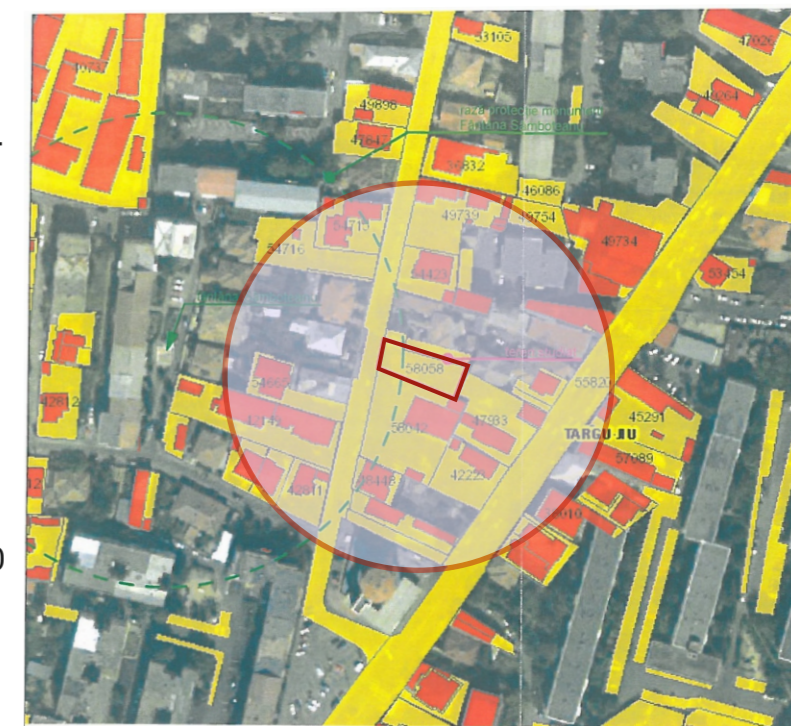
PLAN INCADRARE 1:2000

PLAN DE SITUATIE SC. 1: 500 CONFORM DTAC ÎNTOCMIT DE SC AMC 21 ARHITECT SRL AUTORIZAȚIE NR.706 DIN 30.12.2020